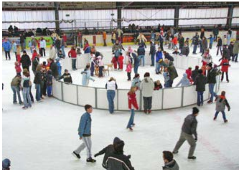
Abb.: öffentliches Eislaufen in der Eissporthalle

3. Der Landtag begrüßt den Vorstoß der Bundesfamilienministerin Frau von der Leyen, die Zahl der Betreuungsplätze für Kinder unter drei Jahren auf rund 750 000 zu verdreifachen. Insbesondere, weil Niedersachsen ein hohes Handlungsdefizit hat. Niedersachsen hat bundesweit die schlechteste Versorgung mit Kita-Plätzen. Für 20 % der Kindergartenkinder steht kein Kita-Platz zur Verfügung. Weiterhin sind 85 % der vorhandenen Plätze lediglich für eine 4-stündige Aufnahme der Kinder eingerichtet.